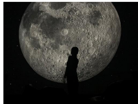
▲「Bar PLANETARIA」にてスマートフォンで撮影

月光浴のようにリラックスしたひとときをお過ごしいただくために、こだわりの音楽や食をお届けします。美しい月の光を浴びながらお酒を楽しむ、贅沢な癒しの時間をお過ごしください。