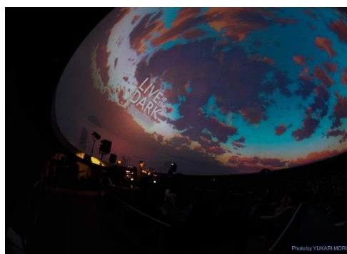
過去の公演の様様